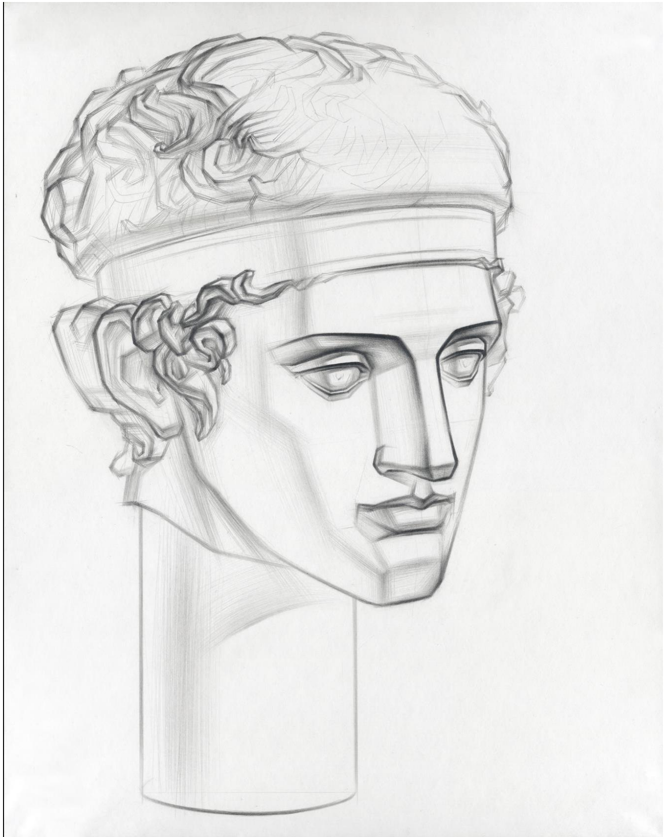
Рисунок гипсовой головы «Диадумен»