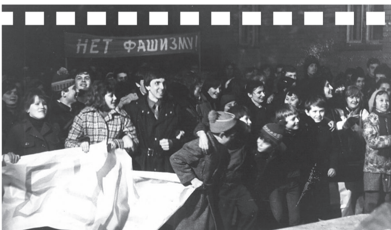
▲ Митинг солидарности в студенческом городке, 1981 год