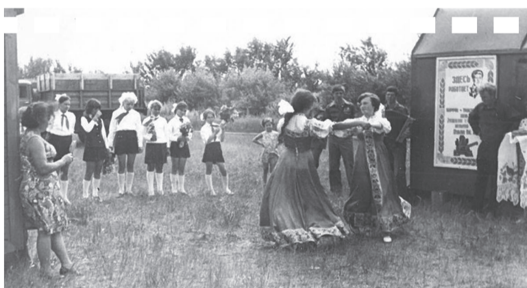
▲ Выступление агитбригады ССО, 1977 год