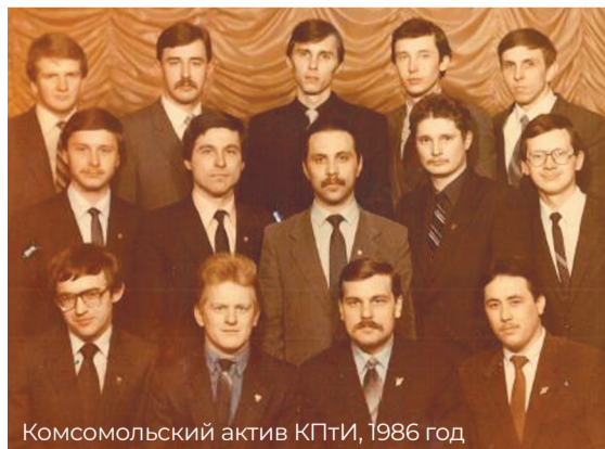
Комсомольский актив КПТИ, 1986 год

Созданный по инициативе комитета комсомола института СТЭМ «Куполин» в 1987 году занял первое место на всесоюзном конкурсе СТЭМов в Волгограде.