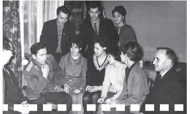
▲ Встреча комсомольского актива с космонавтом Павлом Поповичем, 1968 год

Стилистика, орфография и пунктуация подлинника отчёта, хранящегося в Самарском государственном архиве социально-политической истории, сохранены.