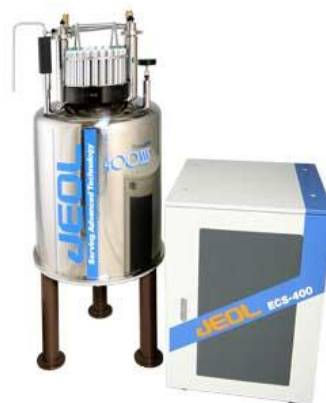
ECS-400 NMR System